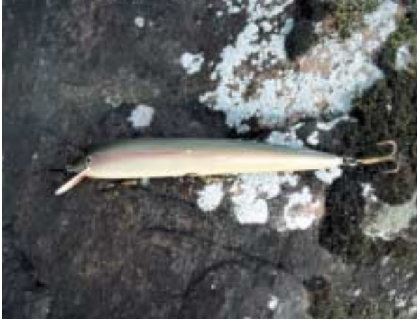
V.l.n.r.: Aufgespaltener Großwobbler nach einem Fehlbiss beim Schleppen; Guide Claus mit einem 47er Prachtbarsch aus dem Ränken; Sven Heininger präsentiert einen typischen „Schweden“-Hecht.